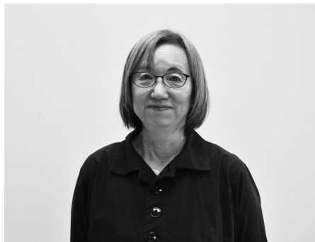
ワークを中心に思いを伝え合う体験を